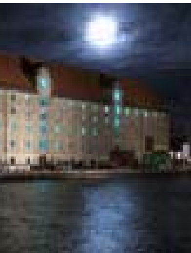
Et historisk hus Pakhuset og Den Grønlandske Handels Plads var i 200 år handelscentrum og mødested for mennesker, der sejlede på havene i nord.