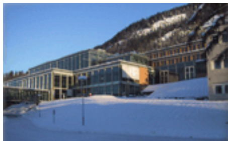
Vinterbillede af Høgsholen i Lillehammer